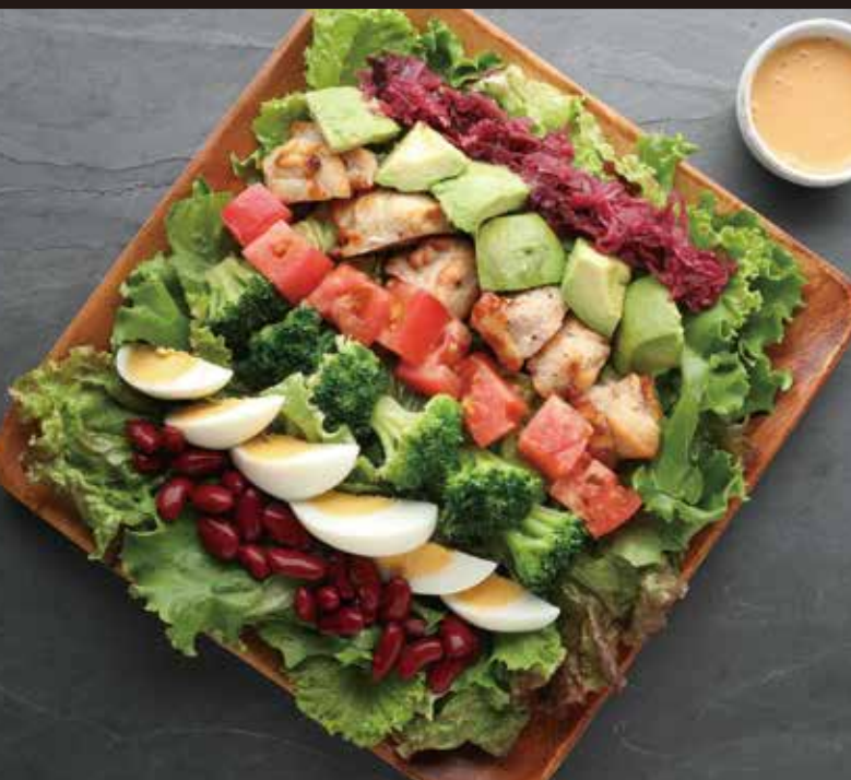
7種の具材のチキンコブサラダ ¥1,300