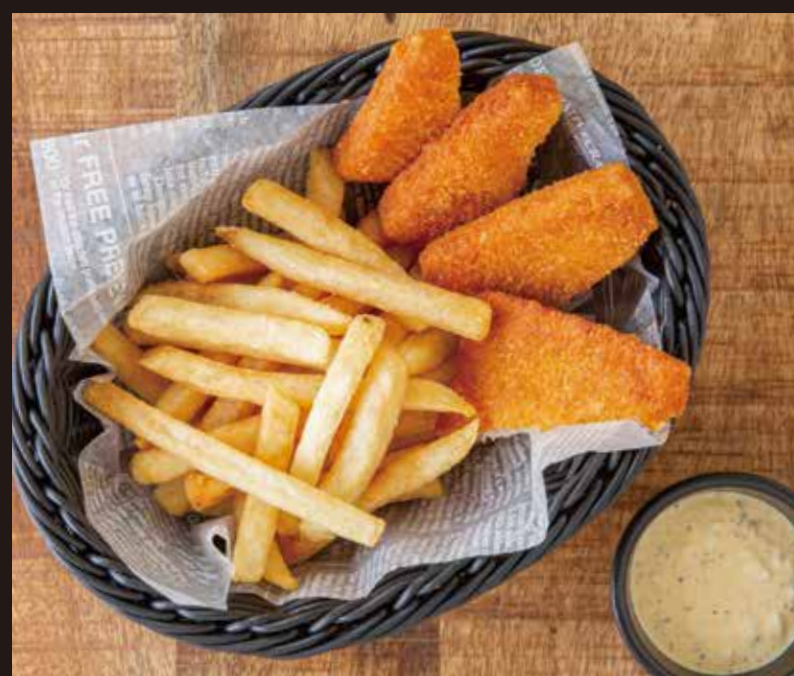
フィッシュ&チップス ¥1,100