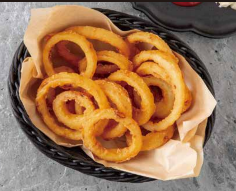
オニオンリング ※ディップは付きません。 ¥650