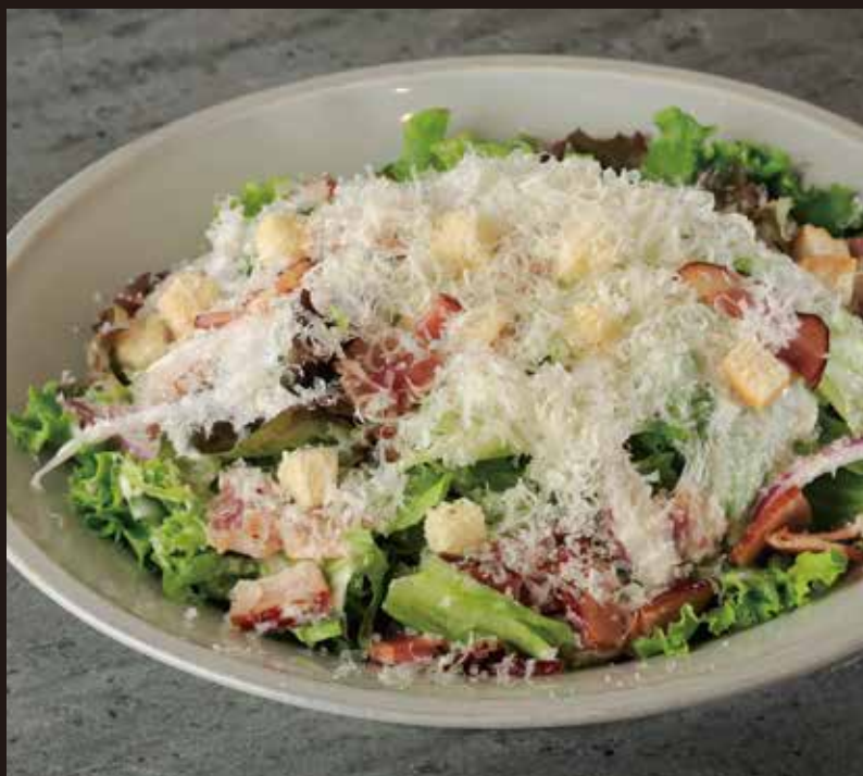
たっぷりチーズのシーザーサラダ ¥1,200