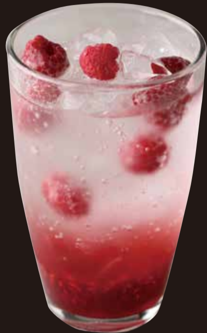
自家製ラズベリーソーダ