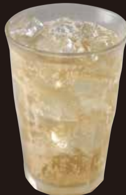
ジンジャーエール