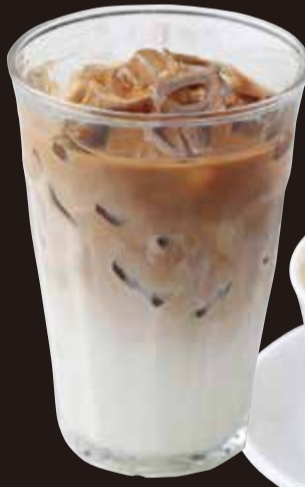
カフェラテ (アイス/ホット)