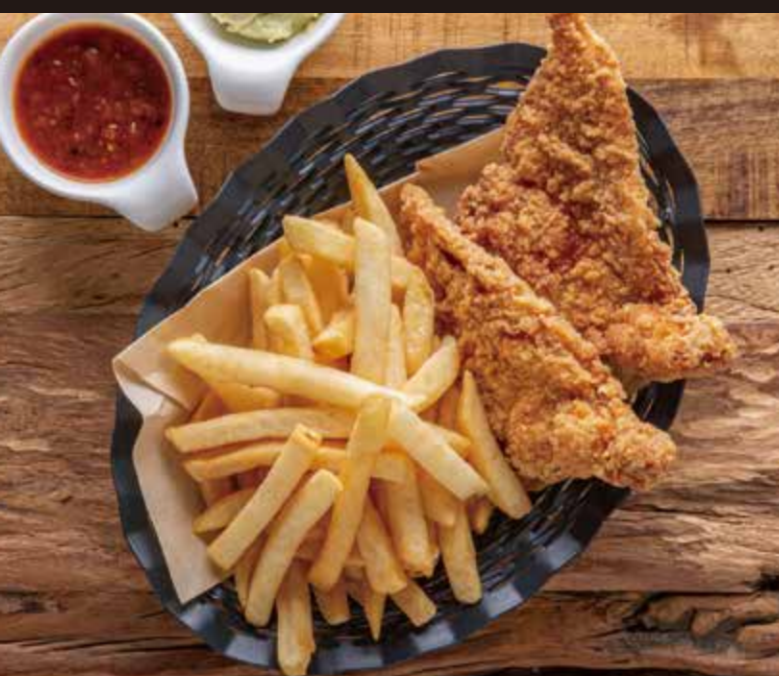
チキンバスケット(ディップ付き) ¥1,200 ※はちみつを使用しています。