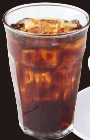
コーヒー (アイス/ホット)