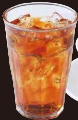
紅茶 (ストレート/ミルク) (アイス/ホット)