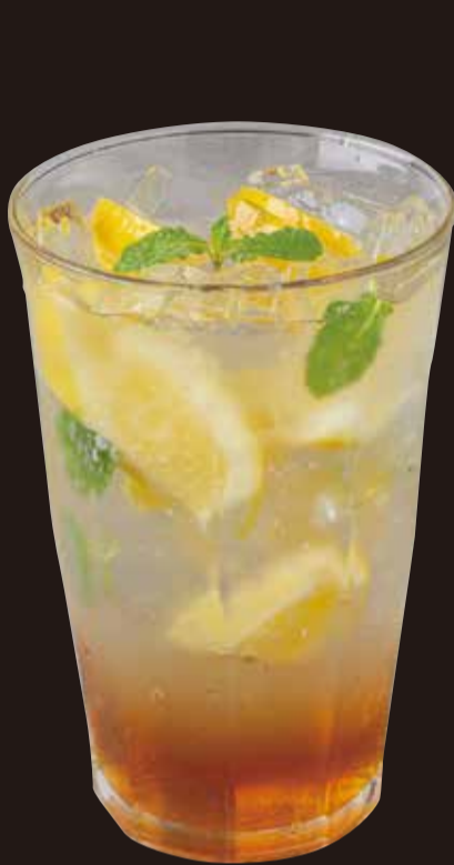
自家製レモネードソーダ ※はちみつを使用しています。