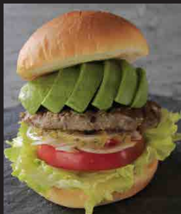
アボカドバーガー