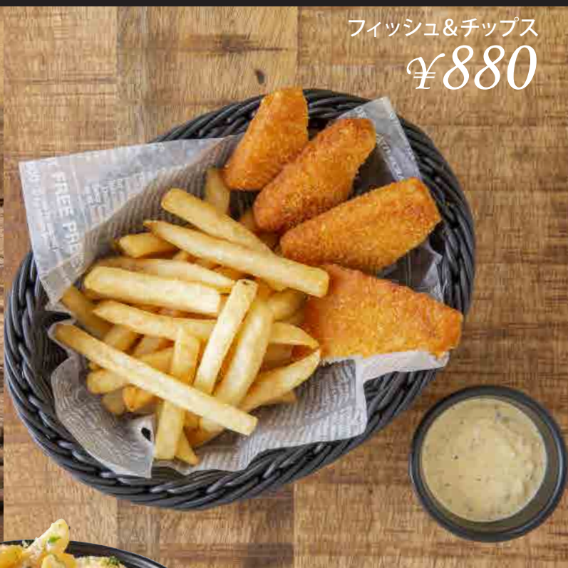
フィッシュ&チップス