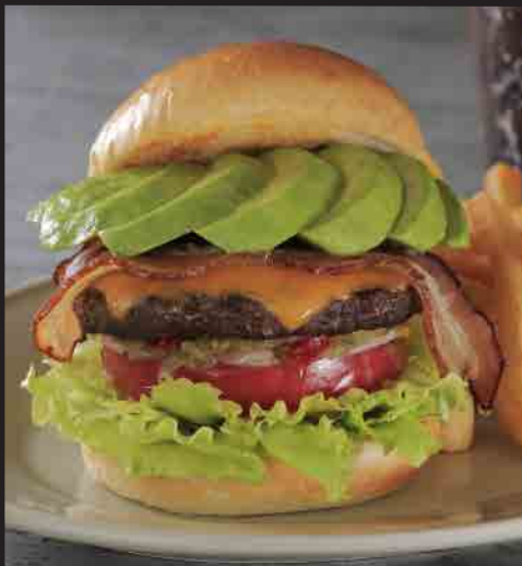
アボカドベーコンチーズバーガー