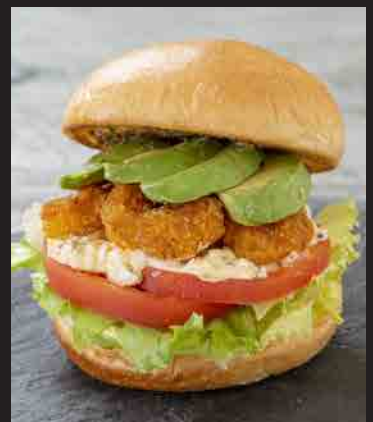
エビとアボカドのサンド