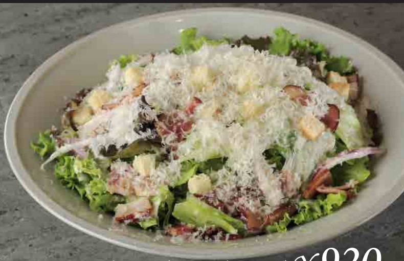
たっぷりチーズのシーザーサラダ ¥920 ハーフサイズ ¥470