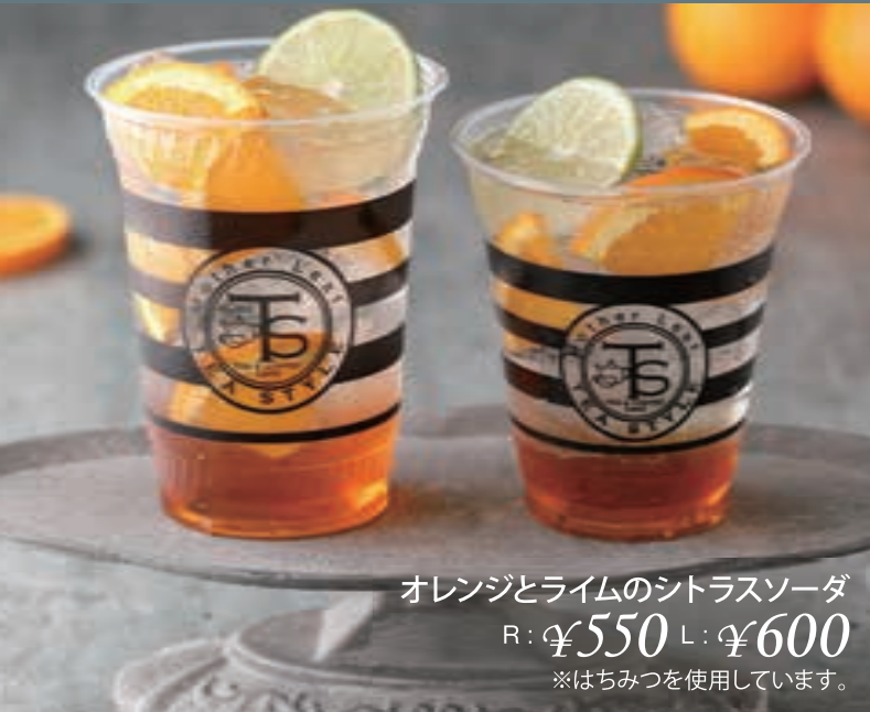
オレンジとライムのシトラスソーダ R: ¥550 L: ¥600 ※はちみつを使用しています。

※表示価格は税込みです。 ※写真はイメージです。 ※カフェインは0.01g(100g当たり)未満をノンカフェインとしています。 ※テイクアウト用のスプーンが不要のお客様はお申し付け下さい。