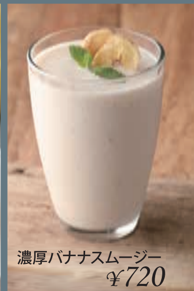
濃厚バナナスムージー ¥720