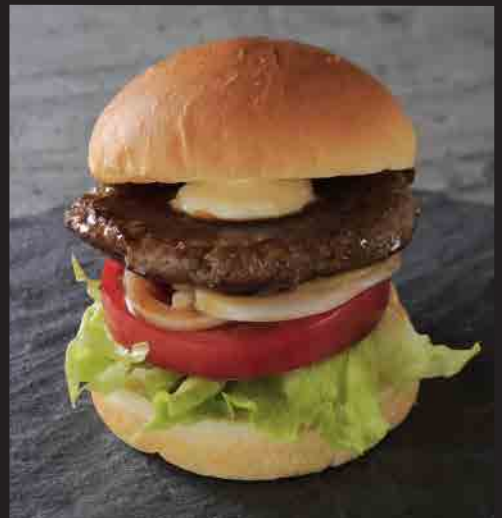
テリヤキバーガー