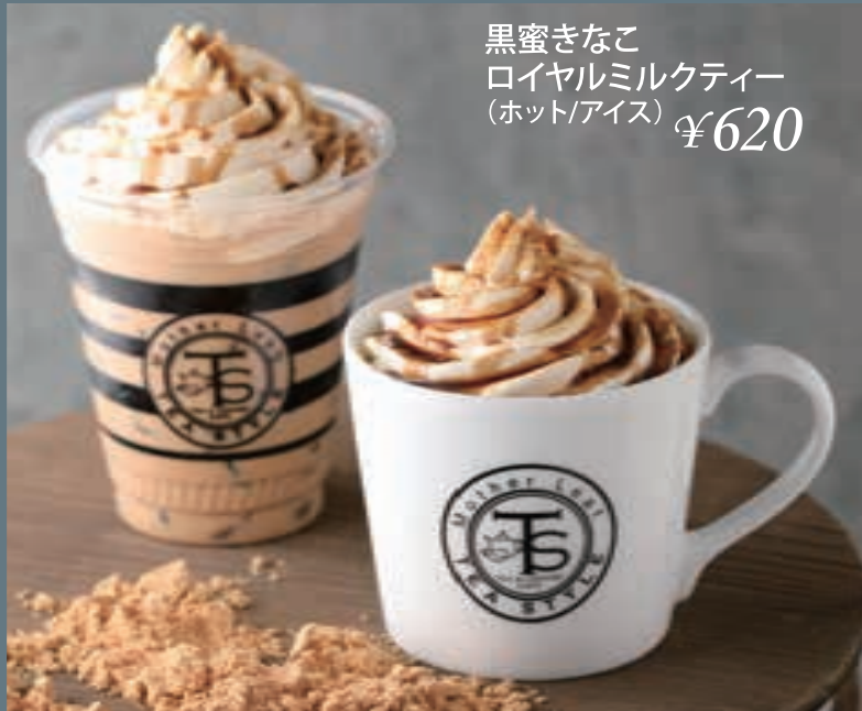
黒蜜きなこ ロイヤルミルクティー (ホット/アイス) ¥620