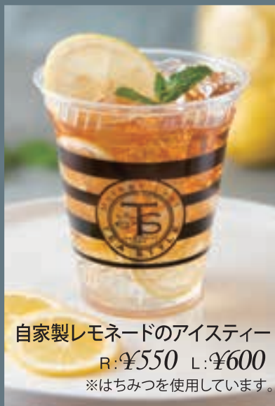
自家製レモネードのアイスティー R: ¥550 L: ¥600 ※はちみつを使用しています。