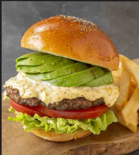
和牛バーガー アボカドわさび