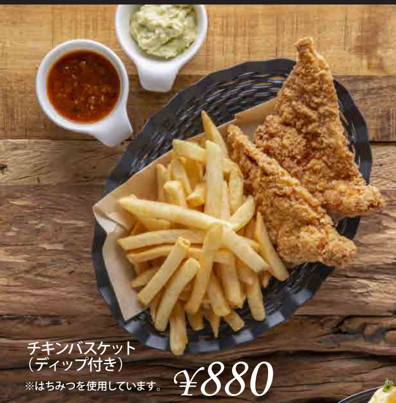
チキンバスケット (ディップ付き)