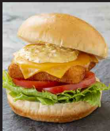
自家製タルタルの フィッシュサンド