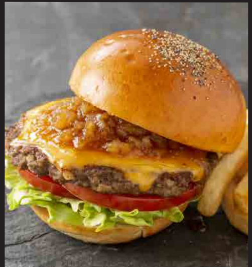
和牛バーガー シャリアピンソース