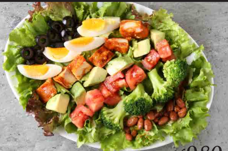
タンドリーチキンのコブサラダ ¥980 ハーフサイズ ¥500