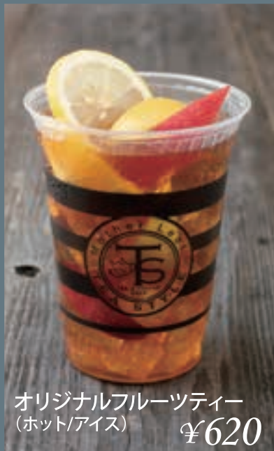
オリジナルフルーツティー (ホット/アイス) ¥620

ブレンドコーヒー(ホット/アイス) R: ¥450 L: ¥490 カフェラテ(ホット/アイス) R: ¥550 L: ¥590 キャラメルマキアート(ホット/アイス) ¥570 ディンブラ(ストレート/オレンジ/ミルク) ¥450 アールグレイ(ストレート/ミルク) ¥470 アイスティー(ストレート/ミルク) R: ¥450 L: ¥490 アイスオレンジティー ¥500 カモミールシトラスティー(ノンカフェイン) ¥490 ルイボスブレンドティー(ノンカフェイン) ¥490 信州産ペパーミントハーブティー(ノンカフェイン) ¥490 ジンジャーエール ¥450 ペプシコーラ ¥450 オレンジジュース ¥480