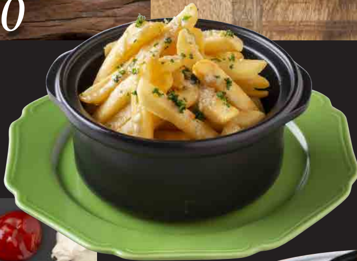
モスチキンディップ