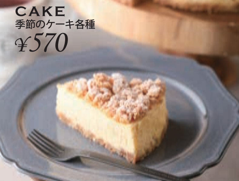
CAKE 季節のケーキ各種 ¥570