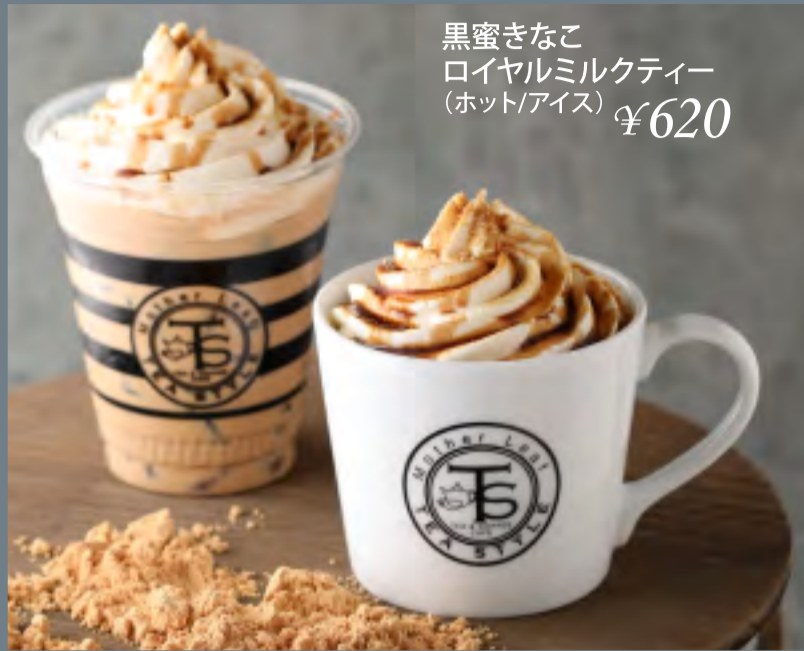
黒蜜きなこ ロイヤルミルクティー (ホット/アイス) ¥620