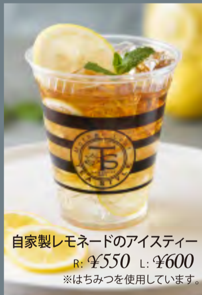
自家製レモネードのアイスティー R: ¥550 L: ¥600 ※はちみつを使用しています。