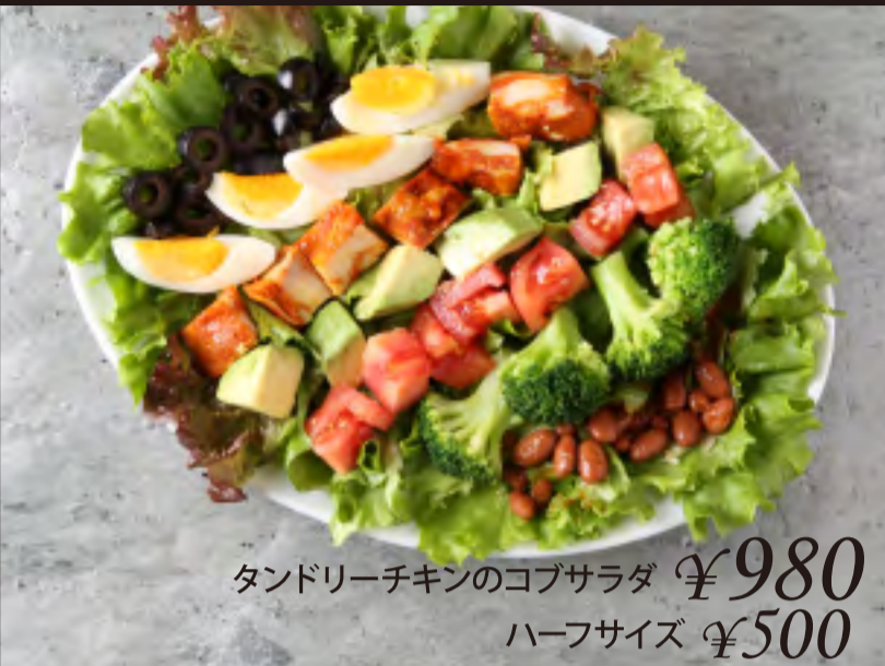
タンドリーチキンのコブサラダ ¥980 ハーフサイズ ¥500