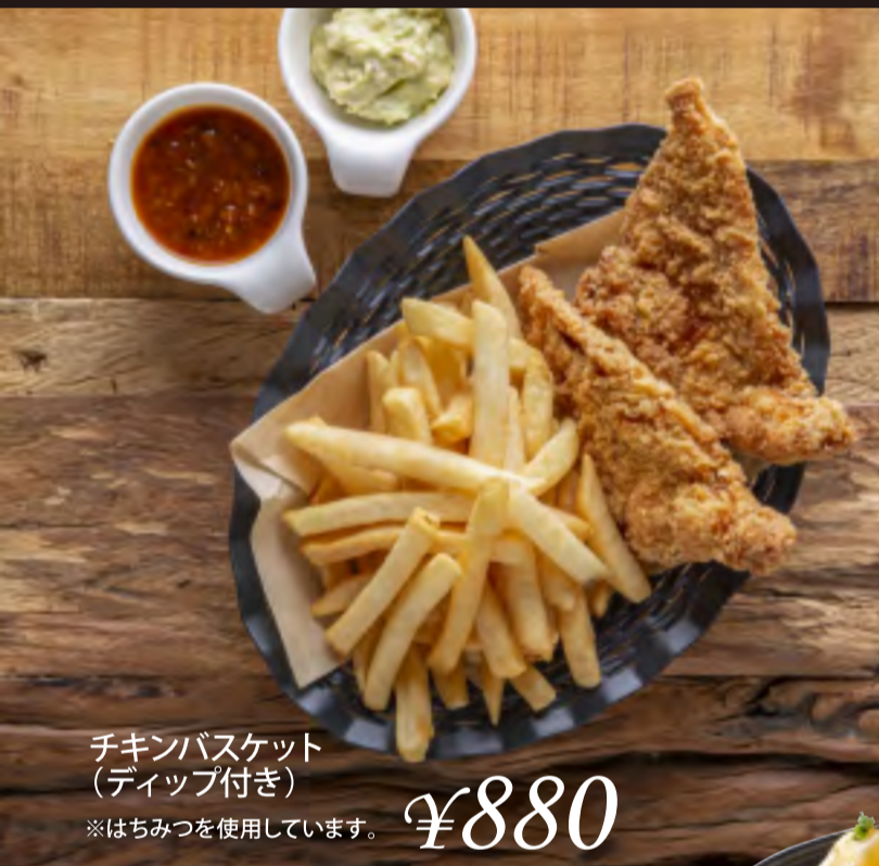
チキンバスケット (ディップ付き) ※はちみつを使用しています。 ¥880