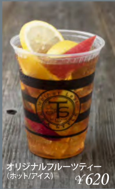
オリジナルフルーツティー (ホット/アイス) ¥620