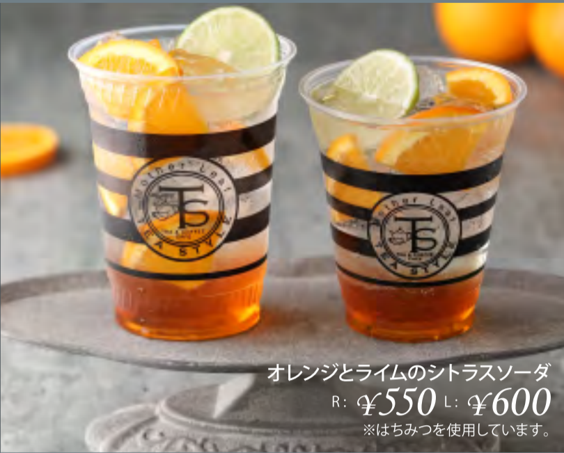
オレンジとライムのシトラスソーダ R: ¥550 L: ¥600 ※はちみつを使用しています。

※表示価格は税込みです。 ※写真はイメージです。 ※カフェインは0.01g(100g当たり)未満をノンカフェインとしています。 ※テイクアウト用のスプーンが不要のお客様はお申し付け下さい。