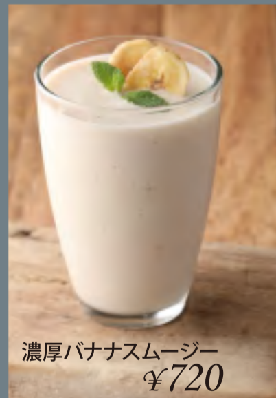
濃厚バナナスムージー ¥720