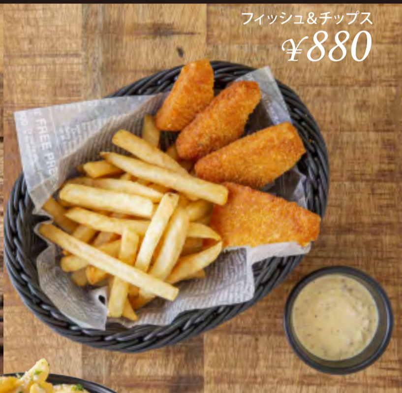
フィッシュ&チップス ¥880