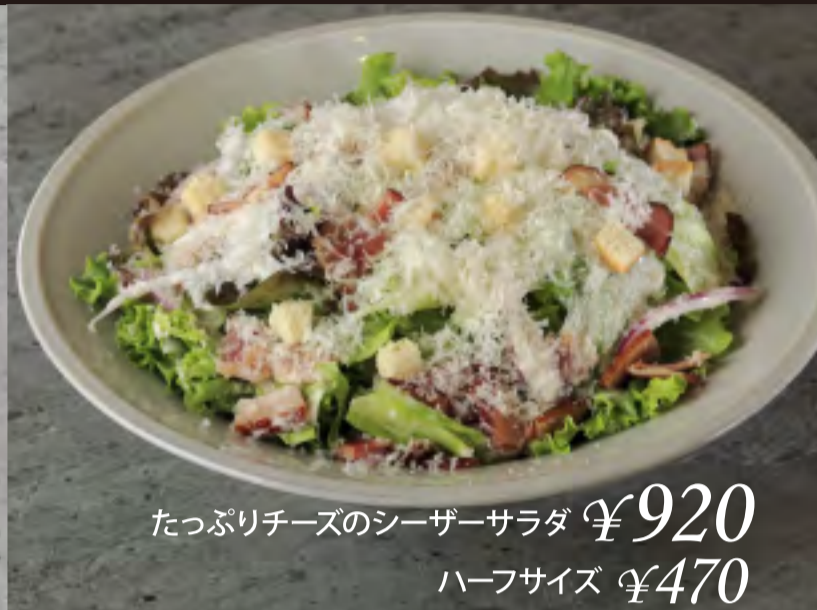
たっぷりチーズのシーザーサラダ ¥920 ハーフサイズ ¥470