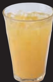
オレンジジュース ¥480