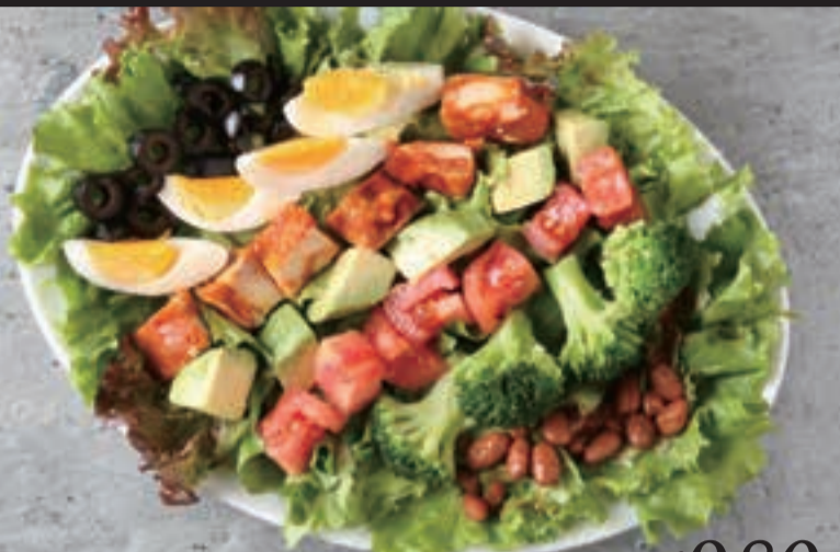
タンドリーチキンのコブサラダ ¥980 ハーフサイズ ¥500