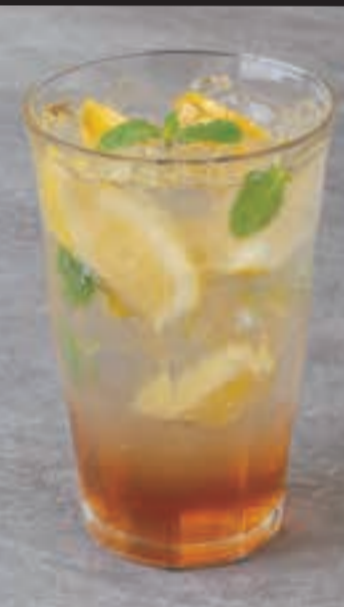
自家製 レモネードソーダ ※はちみつを使用しています。 ¥600