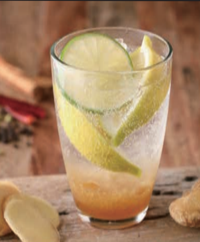
生姜好きのための自家製ジンジャーエール ¥600