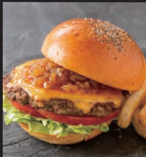
和牛バーガー シャリアピンソース