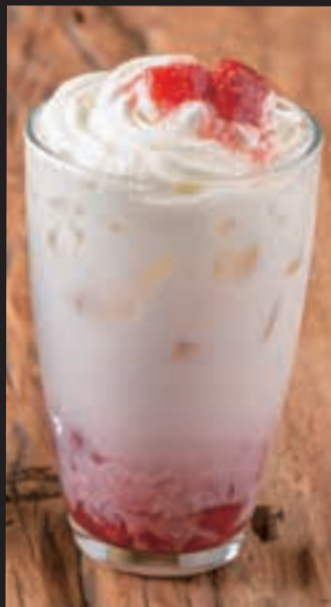
アイストロベリーラテ ¥600