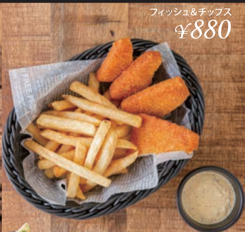
フィッシュ&チップス ¥880