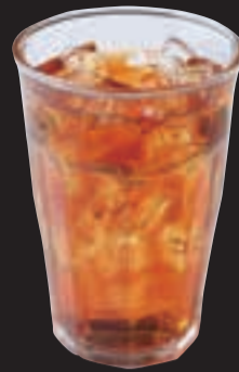
アイスティー (ストレート/ミルク) ¥450