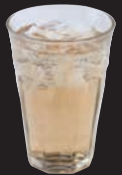
ジンジャーエール ¥450