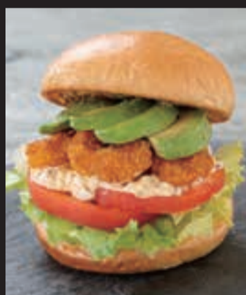
エビとアボカドのサンド