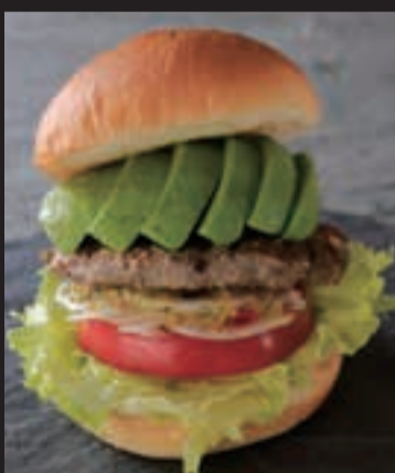
アボカドバーガー