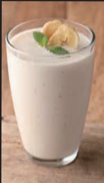
濃厚バナナスムージー ¥720