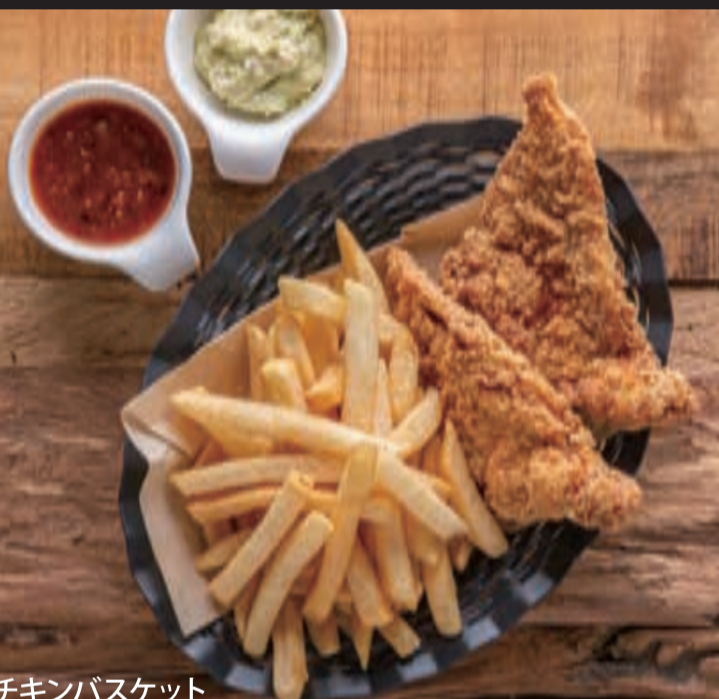
チキンバスケット (ディップ付き) ¥880 ※はちみつを使用しています。