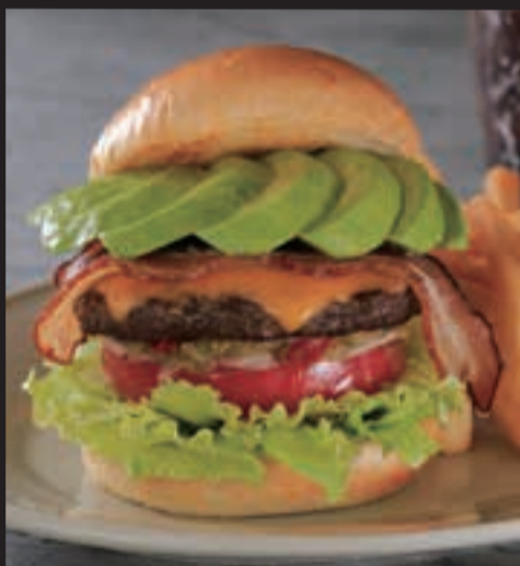
アボカドベーコンチーズバーガー