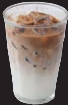
アイスカフェラテ ¥550