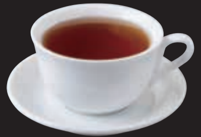
ホットティー (ストレート/ミルク) ¥450