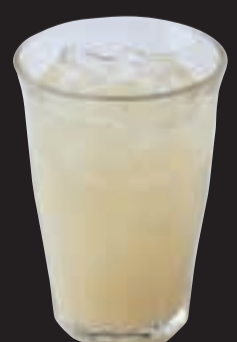
グレープフルーツジュース ¥480