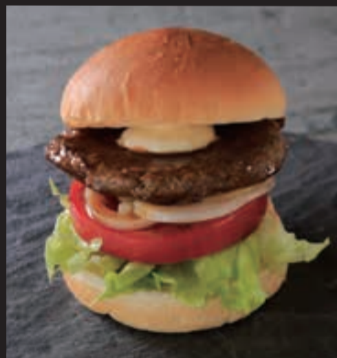
テリヤキバーガー