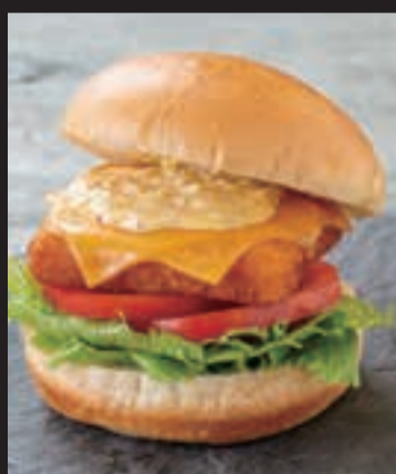
自家製タルタルの フィッシュサンド