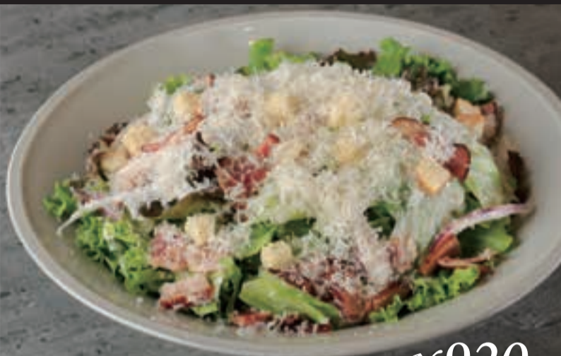
たっぷりチーズのシーザーサラダ ¥920 ハーフサイズ ¥470