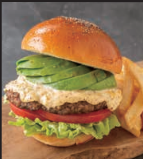
和牛バーガー アボカドわさび