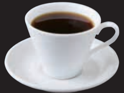
オリジナルブレンド ¥450